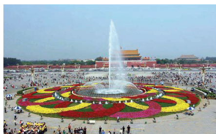
图 1-2: 节日的天安门广场