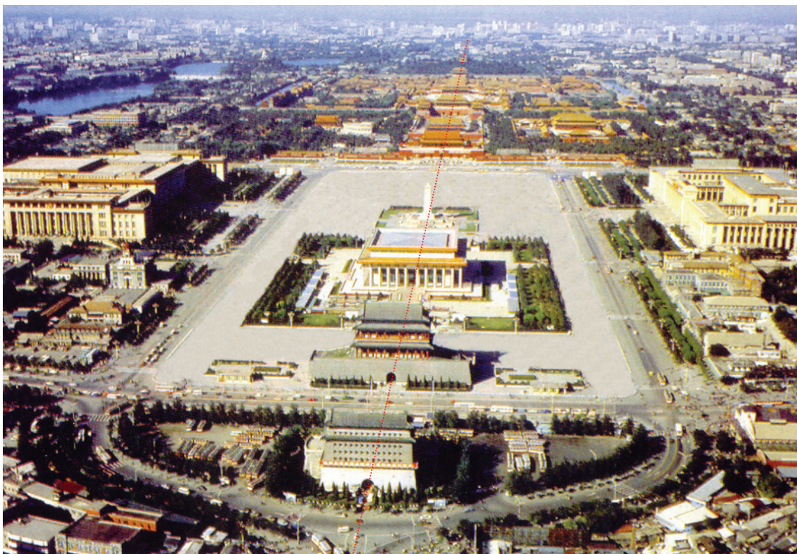
图 1-1: 天安门广场和北京城的中轴 (zhóu) 线

Tian An Men Square and the Axle Line of Beijing