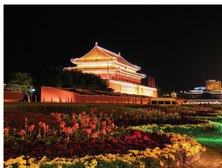
图 1-3: 天安门夜景